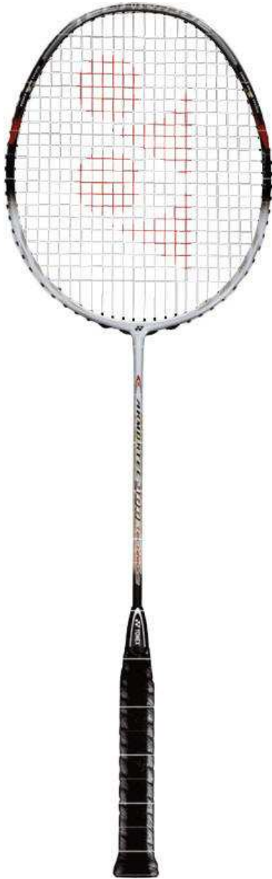
_Yonex Armortec 900 Technique

Aluminium : goedkoop. Nadeel is het gewicht (zwaar) en vrij stijf.