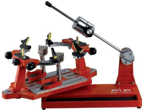
Manuel (via gewichtsarm) bespanningmachines

Bij het bespannen/tunen van een racket komt veel kijken. Voor het bespannen van een racket kan je kiezen uit verschillende bespanningmachines en merken, t.w.: