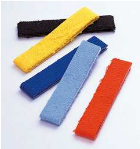
Yonex Badstof grip

Bij het inleveren van je racket kan je eventueel aangeven of de grip ook moet worden vervangen.